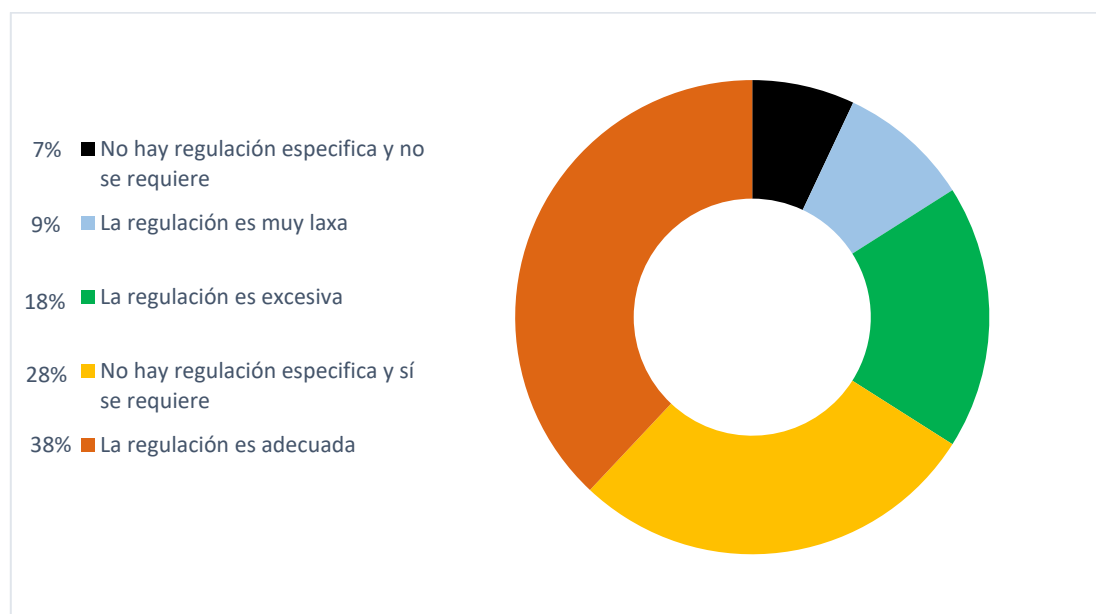
Percepción del entorno regulatorio para empresas Fintech en América Latina